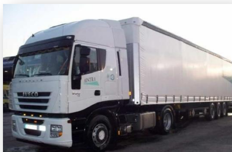
TAUTLINER - MEGA