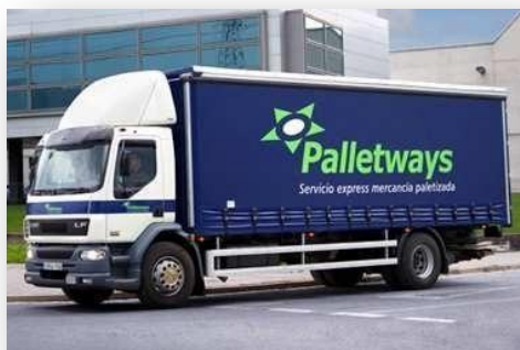
DISTRIBUTION DE PALETERIA, LE MEMBRE "PALLETWAYS"